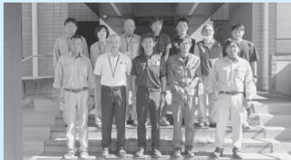
▲佐久管工事業協同組合青年部の方々と企業団職員の合同チームで23軒のお客様のお宅を訪問。

パッキンが摩耗した状態のまま使い続けると、突然止水機能がなくなり、水が大量にかけ流しになってしまうこともありますので、蛇口の水が止まりにくいと感じた場合は早めにパッキンを交換するか水道の設備業者にご相談ください。