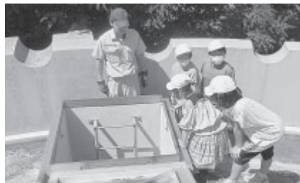
▲望月第一配水池(佐久市)で点検口から中の様子を観察する北御牧小学校の皆さん。「1日でどのくらいの量の水を配っているの?」と質問も。