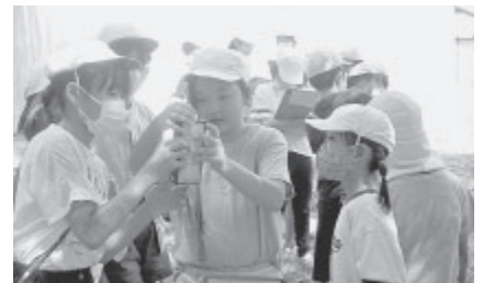
▲望月第一配水池で塩素濃度を測る実験をする北御牧小学校の皆さん。