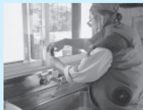
▲摩耗したパッキンを取替。