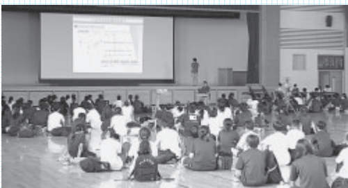
▲被災地での実際の給水活動のお話を中心に講義させていただきました。