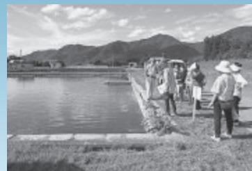
▲上田市染屋浄水場の緩速ろ過池を視察