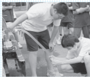
▲給水車から給水袋に水を入れる野沢中学校の生徒さん。

7月25日に災害時の断水している場所での避難所生活を想定した体験学習を行っている野沢中学校の皆さんの授業を講師としてお手伝いしました。