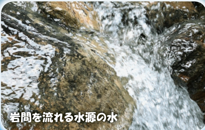
岩間を流れる水源の水