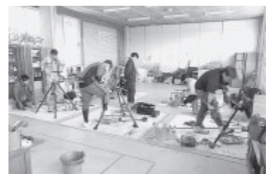
佐久水道企業団では配管技能士の育成に協力しています。