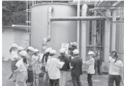
▲御代田浄水場(御代田町)の急速ろ過機を見学する岩村田小学校の皆さん。砂とペットボトルを使ったろ過実験では身を乗り出して集中。

配水池も併設された御代田浄水場は見学場所としてとても人気が高く、5月29日にはサミットアカデミーエレメンタリースクール佐久の皆さんが、6月25日には岩村田小学校の皆さんが見学を訪れました。