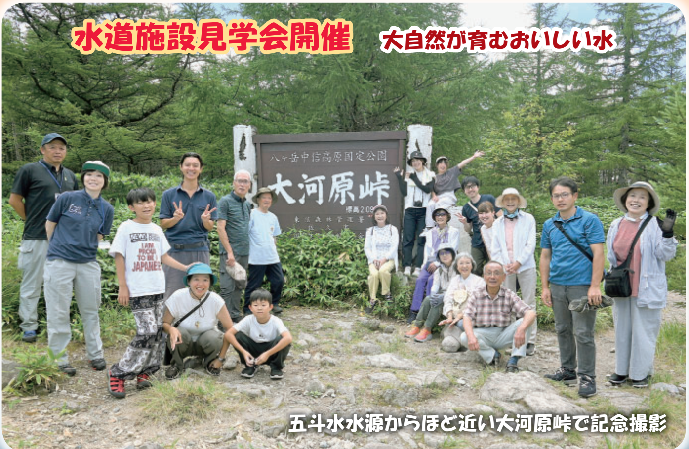
五斗水水源からほど近い大河原峠で記念撮影