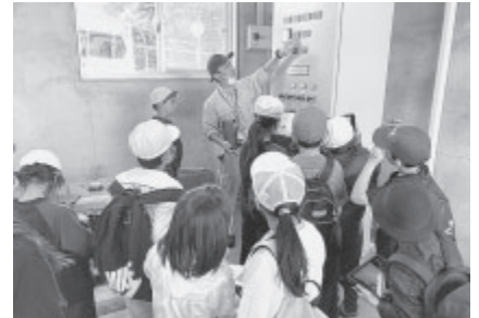
▲御代田浄水場と配水池の情報を監視・記録する機械を見学するサミットアカデミーエレメンタリースクール佐久の皆さん。施設の画像なども撮影して勉強。