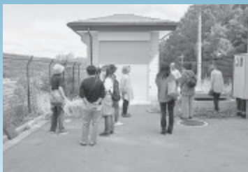
▲高野町第4水源（佐久穂町）を視察

視察では、午前中に企業団の管理する大石水源、高野町着水井、高野町配水池、稲荷山配水池などの運用状況をご確認いただきました。また、午後は上田市上下水道局の管理する染屋浄水場を訪問し、企業団との水道施設の特色や運用状況の違いなどに関し、理解を深めていただき、ご意見を頂戴しました。