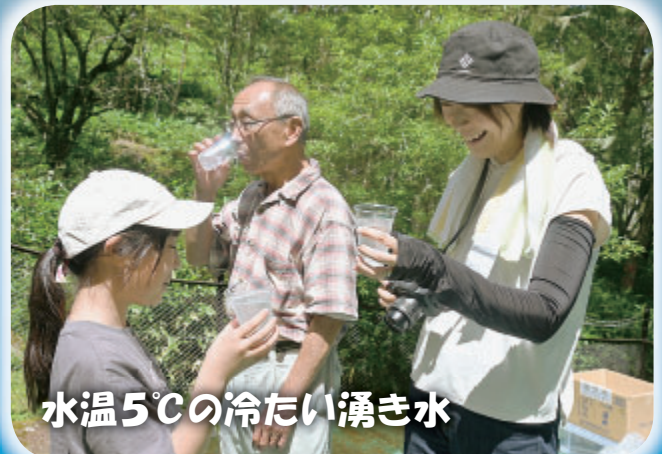
水温5℃の冷たい湧き水